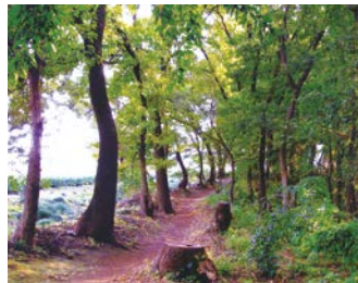
南野川ふれあいの森に広がる自然

地区もあります。散策できる地区もありますので、生き物に注意しながら、区内の身近な自然を感じてみてください。 囲園区役所道路公園センター☎877-1661、FAX877-9429