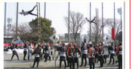
迫力満点ははしご乗り(平成20年中原地区)