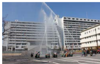
迫力ある一斉放水