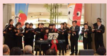
「幸せのメロディー」をお届けします