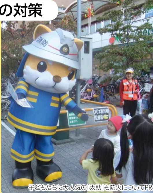
子どもたちに大人気の「太助」も防火についてPR