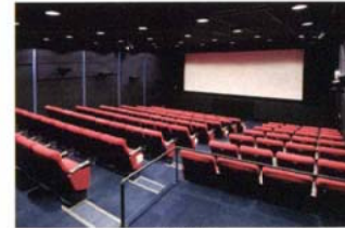
川崎市アートセンター