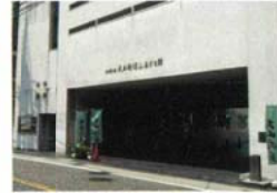
川崎市大山街道ふるさと館