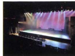
ラゾーナ川崎プラザソル