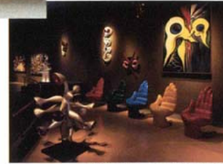
川崎市岡本太郎美術館