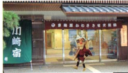
東海道かわさき宿交流館と六さん

The City of Kawasaki invites citizens actively engaged in fields of culture, arts and sports to become the Cultural Envoys of Kawasaki and work in cooperation with the promotion of a positive image for the city both in Japan and abroad. Duties of a Cultural Envoy involve delegation visits to the City of Kawasaki's domestic and international Sister and Friendship Cities for exchange activities and cultural events. In addition, the City seeks recommendations and proposals from the Cultural Envoys to further the promotion of culture.