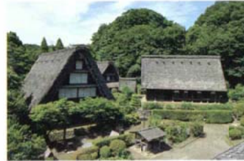
川崎市立日本民家園