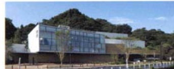
川崎市藤子・F・不二雄ミュージアム