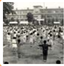
ふるさとアーカイブ 高津小学校校庭で行われたラジオ体操(昭和45年) 子どもから大人まで多くの人が参加しました。