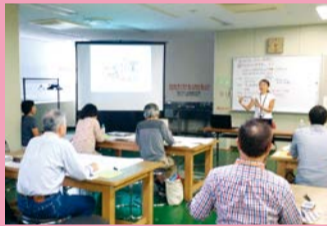
地域の寺子屋事業 コーディネーター養成講座

子育て世代、シニア世代、ボランティア活動を始めたい人、日本語を勉強したい外国人市民などを対象に、さまざまな学級・講座を実施しています。平和や人権、男女平等について学ぶ講座や障害のある人の社会参加学習活動も。市民館と区民が協働で学びの場をつくる市民自主学級・市民自主企画事業もあります。