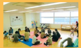
月1回、子育て中の仲間たちと (キューピーランド)