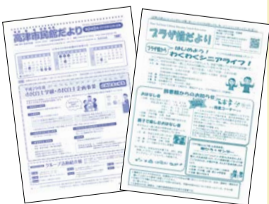
定期発行のたよりやホームページもご覧ください。