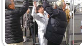
組み立て式仮設トイレの設置