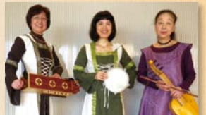
古楽の世界をお楽しみください