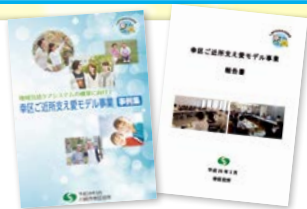
27年度の実施状況をまとめた事例集 29年3月に作成した報告書

全区域展開に向け、年々、実施地区を拡大し事業を展開しています。29年度は新たに8町内会・自治会が加わり、16町内会・自治会で地域住民が主体となって見守り活動を実施します。