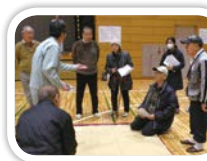
避難所生活スペースの設置

28年度に作成した「幸区避難所開設 運営 訓練マニュアル」を活用し、29年度に新たに配置する「避難所訓練指導員」の指導のもと、全ての避難所で実践的な「避難所開設・運営訓練」を実施します。