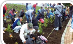
昨年10月に実施した市民100万本植樹運動