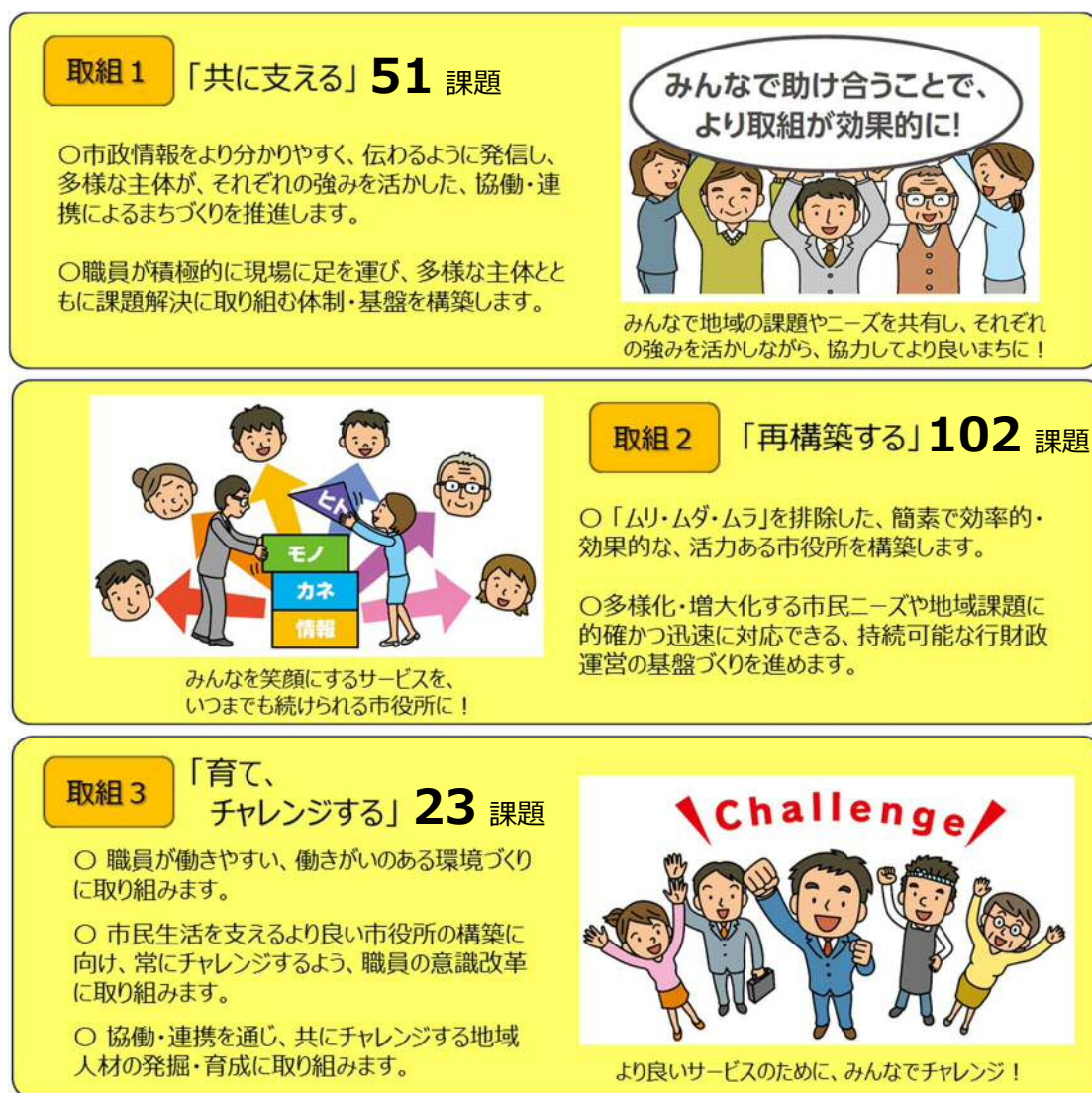
図表1 各取組の概念と改革課題数

その各改革課題において、計画期間初年度となる平成28(2016)年度の取組を推進しました。