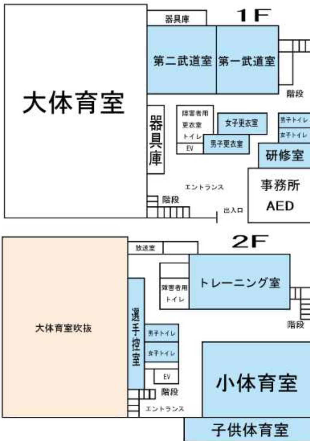
図2-1 麻生スポーツセンターフロアマップ (HP より)