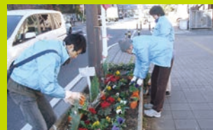
まちの花壇をお花でいっぱいにします