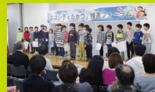
子どもたちが生き物や環境について学んだことを発表します