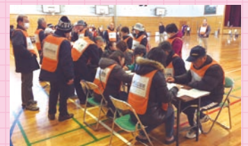
大地震に備えてみんなで訓練