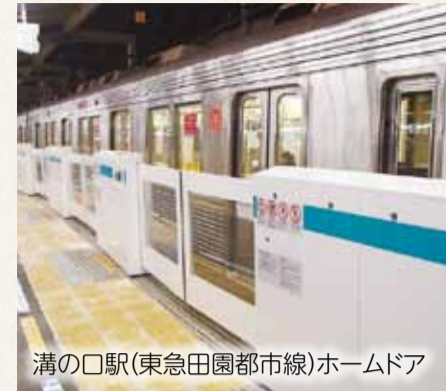
溝の口駅(東急田園都市線)ホームドア