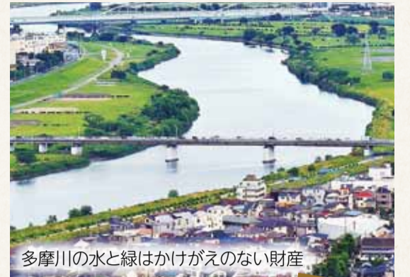
多摩川の水と緑はかけがえのない財産