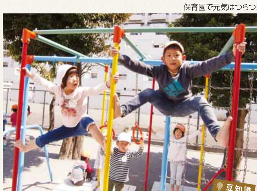
保育園で元気はつらつ!