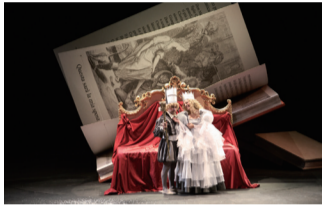
▲「ラ・チェネレントラ」

場所 昭和音楽大学、アートセンター、新百合21ホール、麻生市民館他 チケット販売中☎電話かHPでアルテリッカしんゆりチケットセンター ☎955-3100 (10時～17時。3月中は土・日曜を除く)。[先着順]