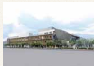
学校施設の環境整備も推進します。イラストは31年度開校の小杉小学校完成イメージ