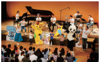
▲0歳からのコンサート