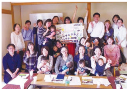
みやまえ子育てフェスタ企画委員会