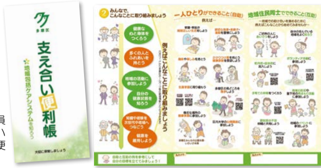
区民会議委員が編集したハンディーな便利帳