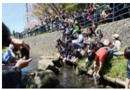
第12回審査委員長特別賞

応募方法 作品を2Lサイズで印刷し、裏面に公共施設などで配布しているチラシの応募票を貼り付けてください