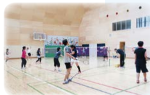
バドミントン教室