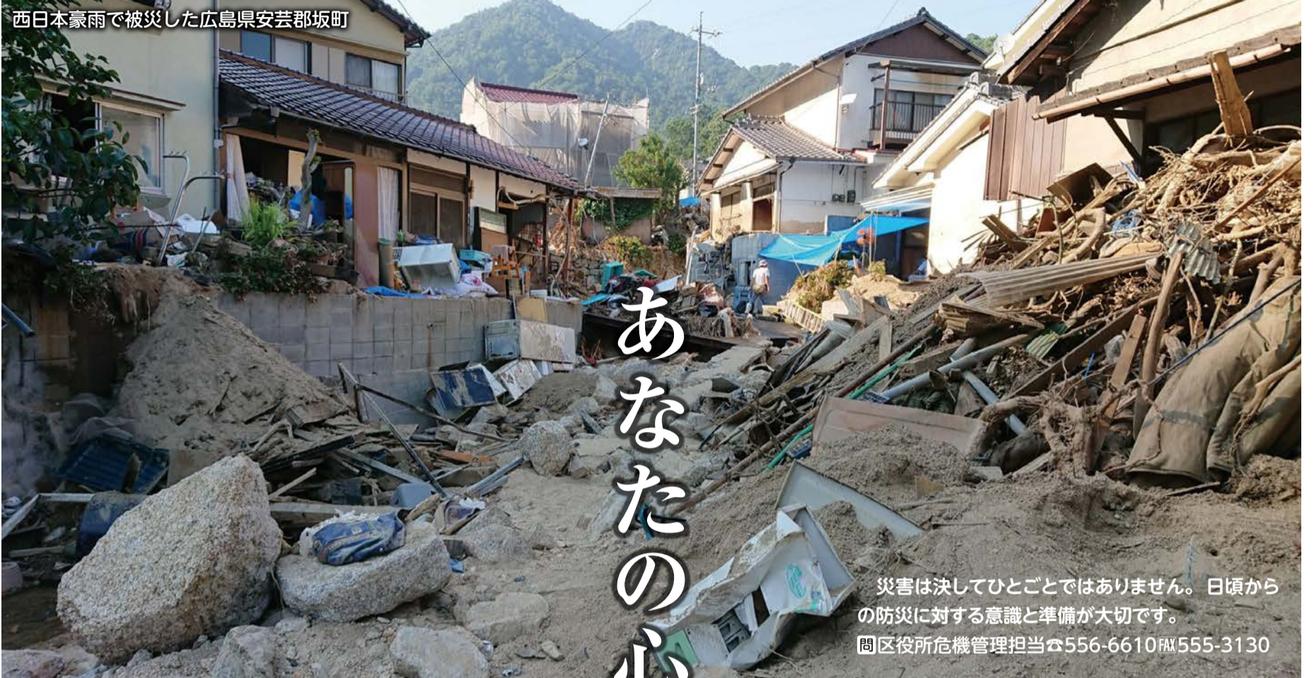
西日本豪雨で被災した広島県安芸郡坂町