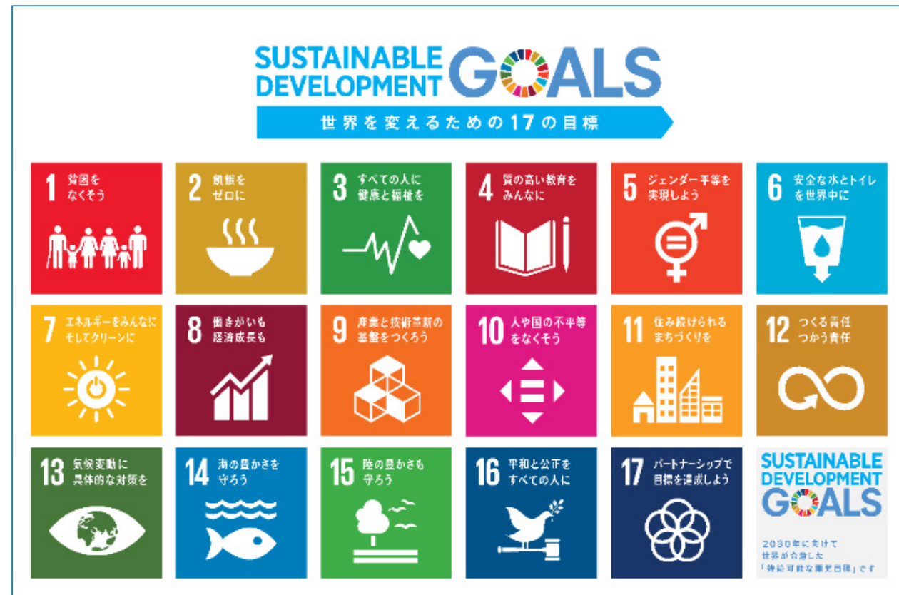
■ SDGs 17のゴール（ロゴ）