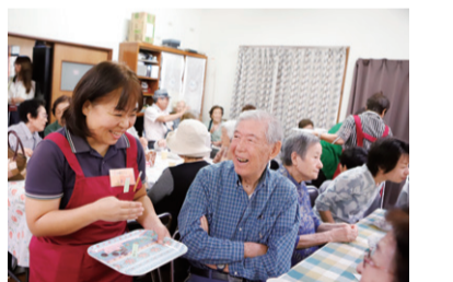
▲土橋カフェ(宮前区)の様子