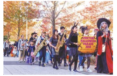
最優秀賞「ハロウィンパレード」