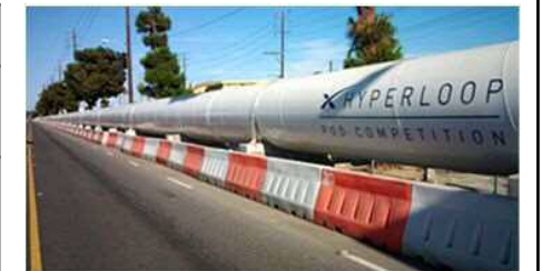
コンペで使用するチューブ(長さ:1,600メートル)