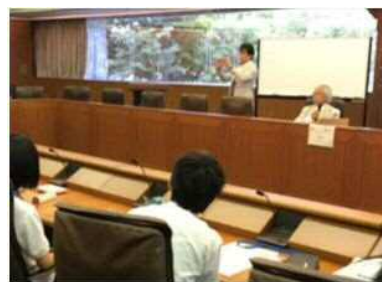
鳥取県での開講式の様子