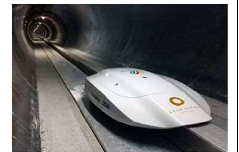
チューブ内の磁気浮上ポッド