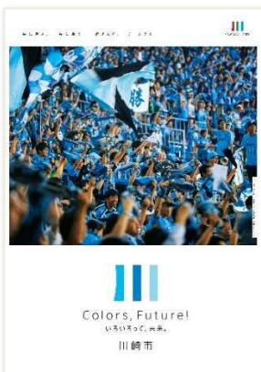
H28 川崎フロンターレ