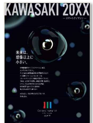
R1 スマートナノマシン