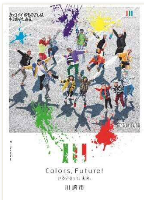
H30 King Of SWAG（ダンサー）