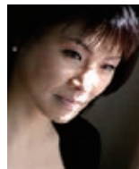
小川典子 Noriko Ogawa

英ギルドホール音楽院教授、東京音楽大学客員教授、ミューザ川崎シンフォニーホールアドバイザー、「ジェイミーのコンサート」主宰、NAS英国自閉症協会文化大使、イプスウィッチ管弦楽協会名誉パトロン、文化庁芸術選奨文部大臣新人賞受賞、川崎市文化賞受賞。