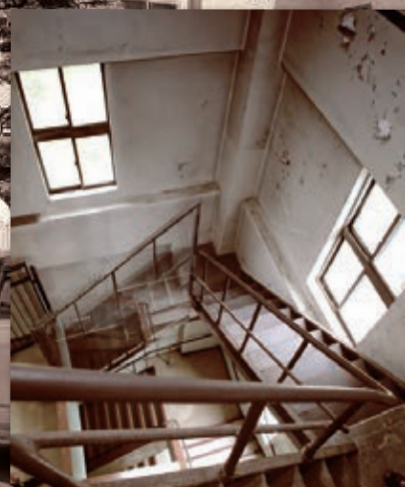
時計塔内部の鉄骨階段の一部を初公開 します。