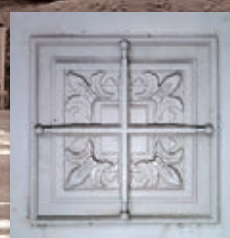
玄関扉のレリーフ