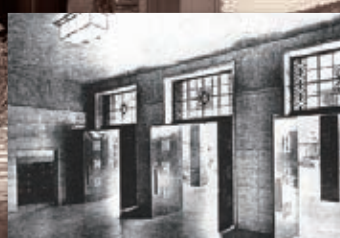
昭和13年当時の玄関の内部写真