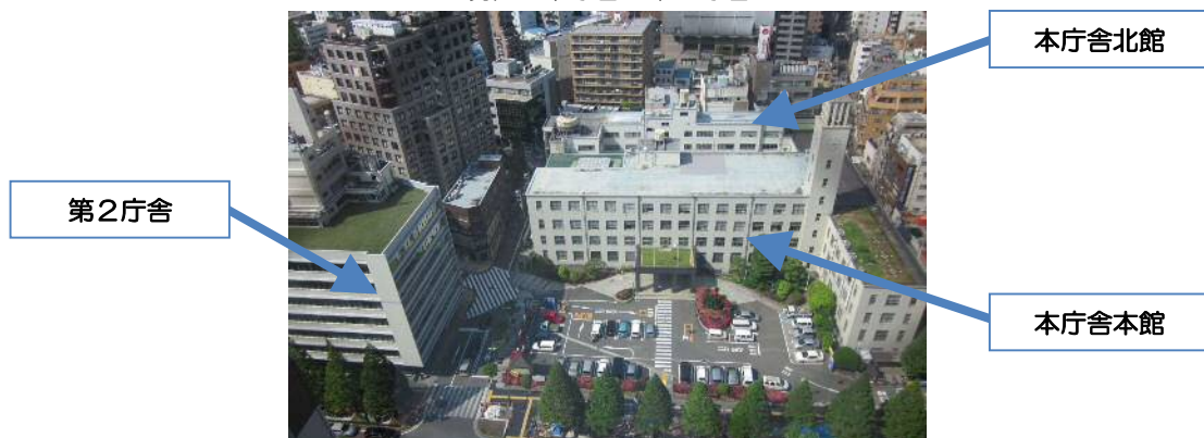
現在の本庁舎・第2庁舎