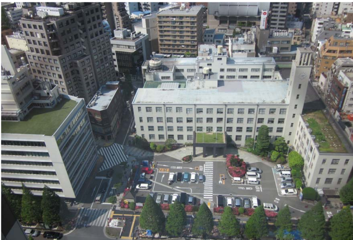
現在の本庁舎と第2庁舎（正面が本庁舎、左手前が第2庁舎）