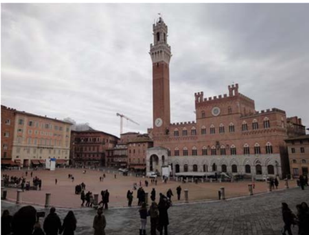
図1 シエナ市庁舎（イタリア） 旧市街地の中心部にあり、街のシンボルとなっている歴史的な市庁舎と広場（カンポ広場）。かつて、シエナが独立した都市国家だった時代に建造された経緯があるため、当時の都市国家を象徴するような重厚でシンボリックなデザインとなっている。

その一方で、新しい本庁舎は、 自治体の顔にふさわしい質の高い建築とすることよりも、できるだけコストを抑えながら必要最低限の機能を満たすようにするなど、経済性、効率性を最優先すべきである との考えもあろうかと思えます。