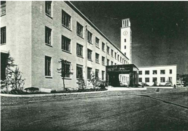
建設当初の本庁舎(昭和13年)

新しい本庁舎は超高層建築物になることが想定されるため、現在の本庁舎をそのまま残すことはできませんが、これまで市民に親しまれてきた建物であるため、本庁舎の建替と併せて、 何らかの形で現在の建物の記憶を継承する方法を検討することが考えられます。