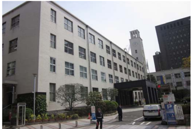
現在の本庁舎(平成26年)

当時は3階建(東側は2階)だったため、時計塔が高く突出しており、窓も重厚なスチールサッシだった。