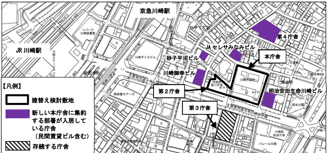
建替え検討敷地周辺図