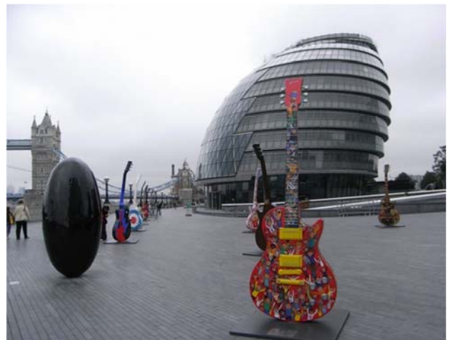
図2 ロンドン市庁舎 個性的なデザインのガラス張りの市庁舎が街のシンボルとなっている。手前は、英国を代表するロックミュージシャン達がそれぞれペインティングのデザインを担当したギターオブジェが並ぶ市庁舎前広場

問10. このことを踏まえて、あなたのご意見にもっとも近いものを下記の中から選んでください。