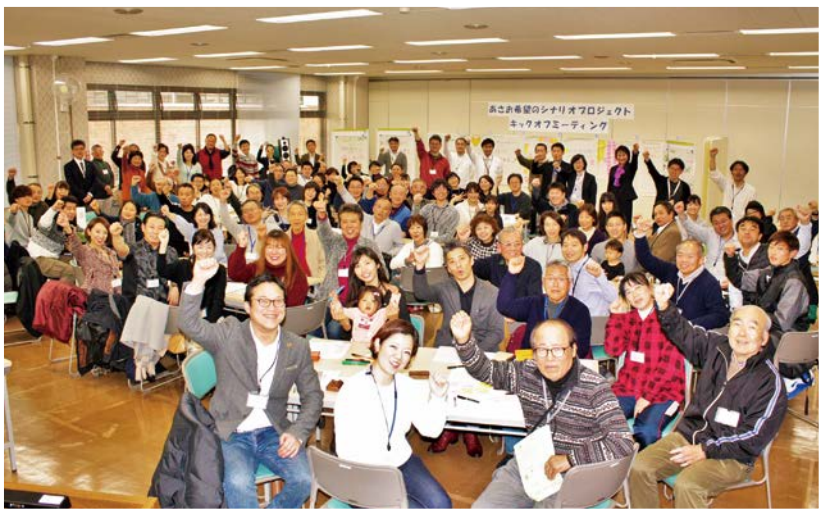
キャッチフレーズは「みんながつながる みんなが輝く I♡ASAOKU」