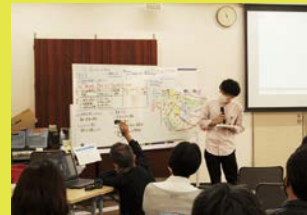
幅広い年代の人が参加してくれています