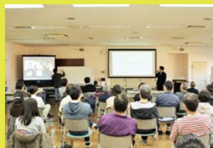
感染対策のためオンラインとの同時開催を実施しました