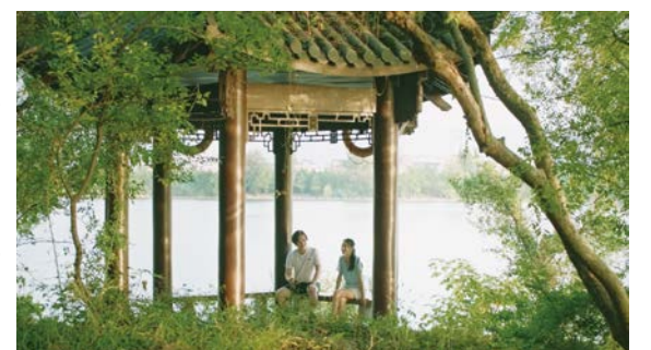
© 2019 Factory Gate Films Rights Reserved

◎今月のおすすめ...『春江水暖～しゅんこうすいだん』3月13日～26日。再開発の只中にある中国の杭州市富陽。家長である老いた母の誕生日に4人の兄弟や親戚たちが集うが、その宴の最中に母が脳卒中で倒れてしまう。認知症が進み介護が必要になった母と、それぞれの人生に直面する4人の息子と孫娘。大河、富春江が流れる街で、変わりゆく世界に生きる親子三代の物語を描く。※日曜最終回、月曜は休映(祝日の場合翌日に振り替え)。