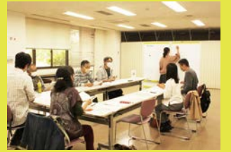
毎回時間が足りなくなるくらい話題が尽きません