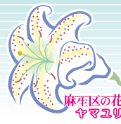
麻生区の花 やまぶら