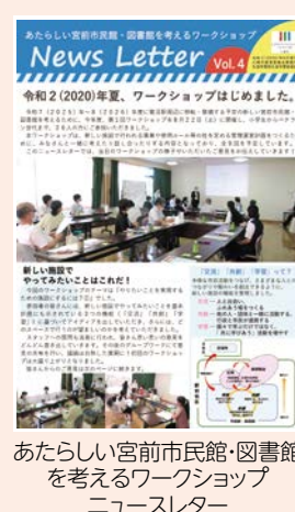
あたらしい宮前市民館・図書館 を考えるワークショップ ニュースレター

取り組みを詳しく説明した宮前区のミライづくりプロジェクトニュースを区内全戸に配布しています(3月下旬)。区HPにも掲載していますので、ぜひご覧ください。 ※プロジェクトに関する各種ニュースレター、通信などについては、宮前区役所、向丘出張所、宮前市民館などに配架しています。