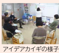
アイデアカイギの様子