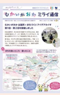
みんなで作る むかいがおかミライ通信

現在、「むかいがおか 出張所×まちづくり アイデアカイギ」(全3回)を開催し、地域と出張所のミライについて、参加者同士で話し合いを進めています。その他、関係団体へのヒアリングを行うなど、地域の皆さんからさまざまな意見をいただいています。令和3年度は、いただいた意見などをとりまとめ、「(仮称)向丘出張所の今後の活用に関する方針」の策定に向け、取り組みを進めていきます。詳細は市HP、区役所などで配布中の「みんなで作るむかいがおかミライ通信」をご覧ください。