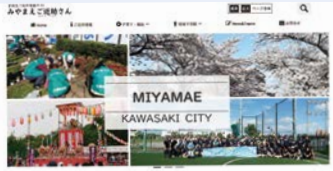
宮前区ご近所情報サイト「みやまへご近助さん」

【主な取り組み】 地域包括ケアシステムの実現に向けて、さまざまな地域活動の情報を町名ごとに掲載し、身近な暮らしの中でのつながりづくりを応援する宮前区ご近所情報サイト「みやまへご近助さん」を運営します。併せて、子育て世代の「ご近助コンシェルジュ」の活動を通じて、町内会・自治会をはじめとする地域活動と子育て世代の相互理解を促進し、多世代交流の場の創出や多様な主体の連携促進に取り組みます。