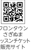
フロントウンスざぎぬま レッスンチケット販売サイト

◎4月16日～5月14日の金曜、21時～21時45分 ☎区内在住、各15人 ¥各500円 ※インターネットに接続できる環境下で、パソコン・スマホ・タブレットなどが必要(通信料は参加者負担)。詳細は、「フロントウンスざぎぬまHP」をご覧ください ☎4月15日からHPでフロントウンスざぎぬま ☎854-0210 FAX862-5030 [先着順] ☎区役所地域振興課 ☎856-3177 FAX856-3280