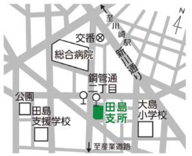
▲田島支所(3階会議室)

World Peace Theater(本町1-3-3)JDSビル1階 ☎各回10人 ☎10月22日までに電話か区HPで。[抽選]