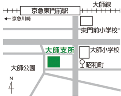
▲大師支所(2階第1・2会議室)