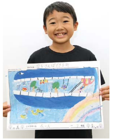
ホースさんと中原区長賞受賞作品