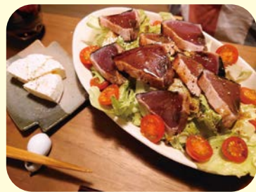
◀手軽にたんぱく質もとれるカツオをのせたパワーサラダ