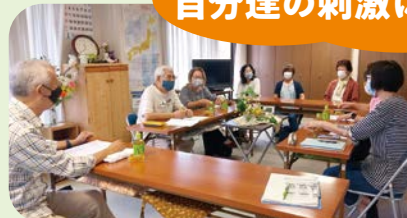
地域の高齢者交流サロン「よりあい処美知」スタッフの皆さん