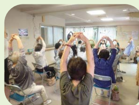
感染対策の上、開催しています