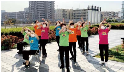
体操を普及する「パンジー隊」の皆さん

■問 区役所地域ケア推進課 ☎044-744-3239 FAX044-744-3196