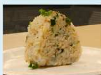
レシピコンテスト2021優勝「サッパリおむすび」