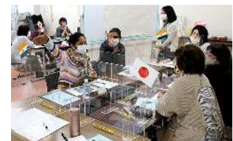
地域づくりワークショップの様子

川崎区らしい地域包括ケアシステムの構築に向けた普及啓発や、地域包括ケアシステムに資する地域活動と区民ニーズのマッチングに取り組むとともに、地域交流・世代間交流の場づくりや、区民が主体となった健康づくり・介護予防の活動を促進するための取組を進めています。