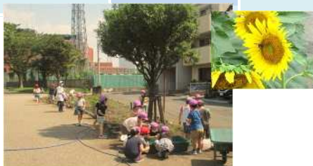
ひまわりの水やり