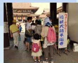
大師サマーフェスタ