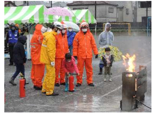
川崎区総合防災訓練