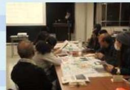
外国人住民向け防災訓練・講座