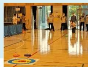
カローリング体験