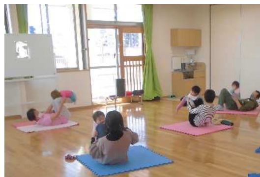
子育て支援講座（親子体操）