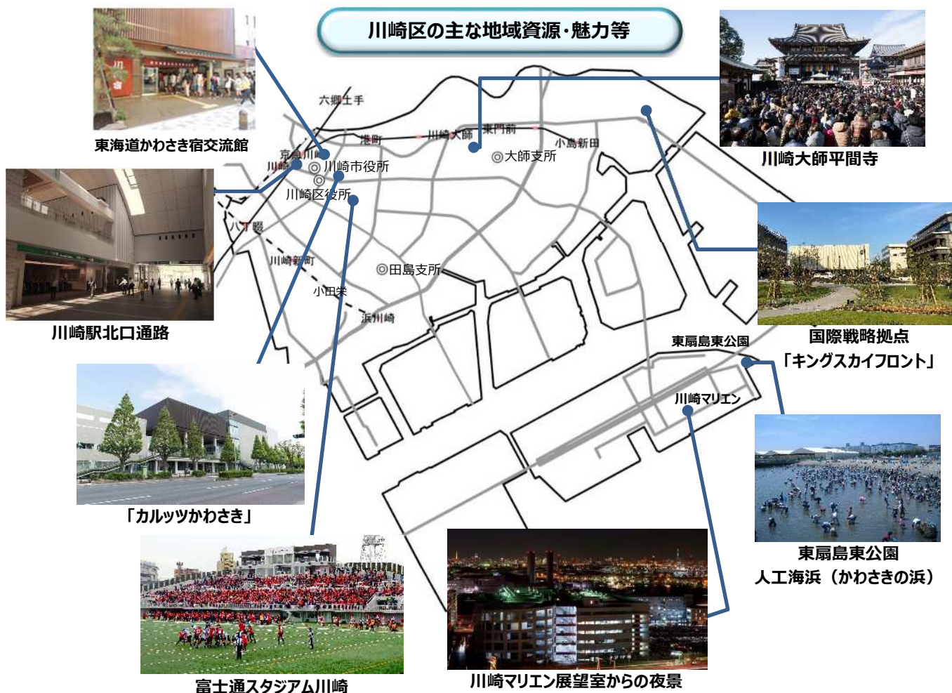
東海道かわさき宿交流館