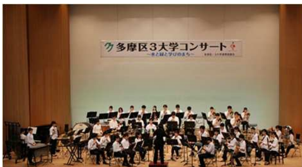
大学生と地域の交流（多摩区3大学コンサート）