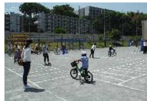
小学校で実施した交通安全教室