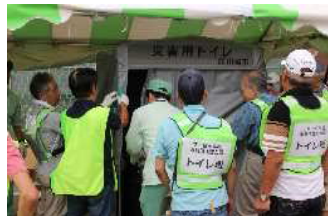
多摩区総合防災訓練での仮設トイレ組立の様子