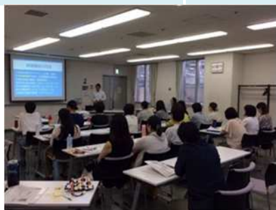
子育て支援者養成講座