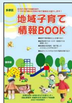
地域の子ども・子育て情報冊子「多摩区地域子育て情報BOOK」