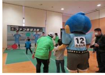
区民が気軽にスポーツを楽しむ「多摩区スポーツフェスタ」