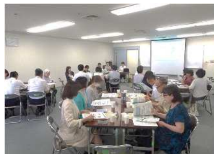
子育て支援団体や関係機関による連携会議