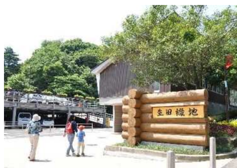
生田緑地東口ビジターセンター