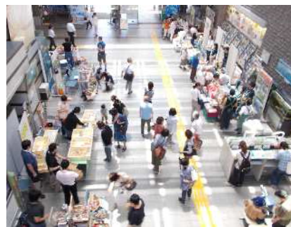
区総合庁舎1階アトリウムで開催される「パサーージュ・たま」