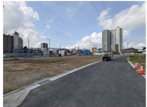
区画整理事業が進む登戸駅付近 令和3（2021）年6月