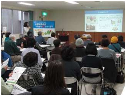
支え合いの地域づくりに係るフォーラム