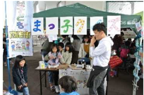
地域イベントへの大学生参加の様子