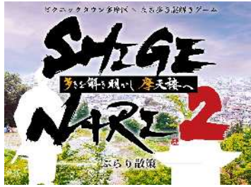
地域周遊イベントの実施