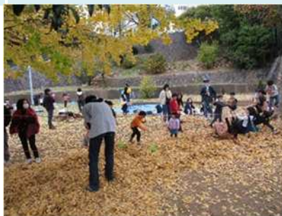
住民主体の外遊びイベント