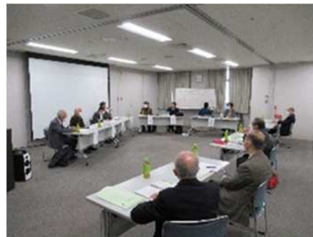
地域活性化に向けた講演会