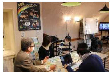
多摩区ソーシャルデザインセンター

区にゆかりのある3大学の知的資源を活かして地域課題の解決を図るとともに、大学生の地域参加を促進し、大学の持つ価値や魅力を活かした地域づくりを進めています。また、「これからのコミュニティ施策の基本的考え方」における区域レベルの取組として、ソーシャルデザインセンターへの運営支援を行うなど、地域で活躍する多様な主体が、市民創発によって地域の課題を解決していくための取組を推進しています。