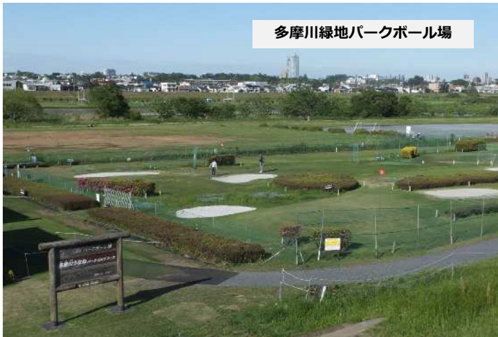
多摩川緑地パークボール場