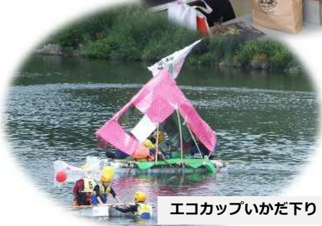
エコカップいかだ下り