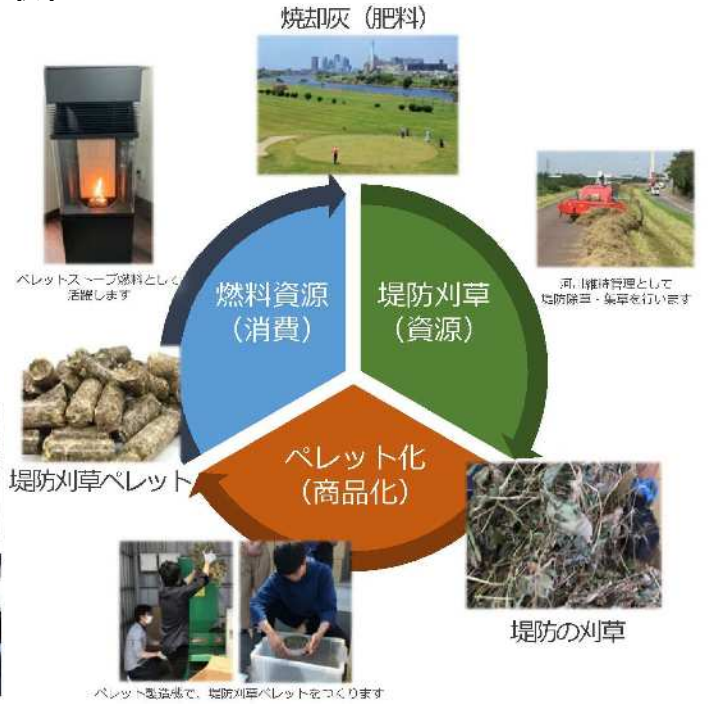
図 地域資源が循環する仕組みの構築 (イメージ)