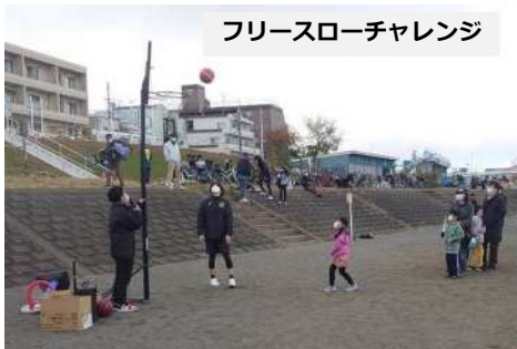
フリースローチャレンジ