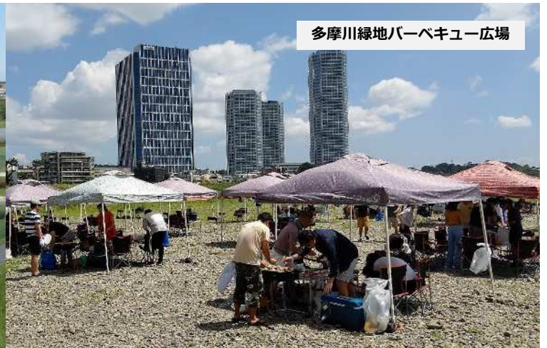
多摩川緑地バーベキュー広場