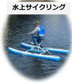
水上サイクリング