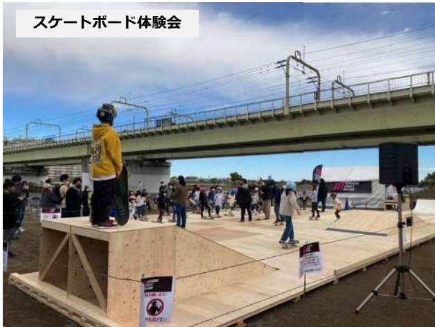
スケートボード体験会