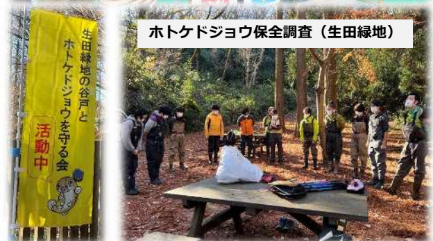
ホトケドジョウ保全調査 (生田緑地)