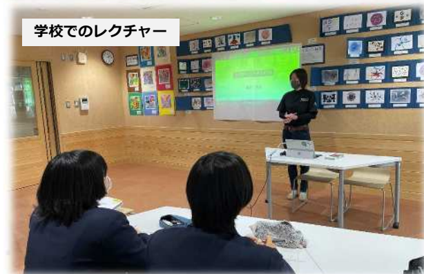
学校でのレクチャー