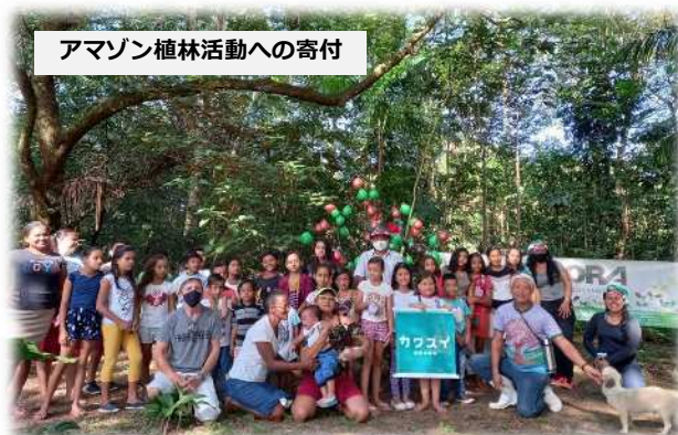
アマゾン植林活動への寄付