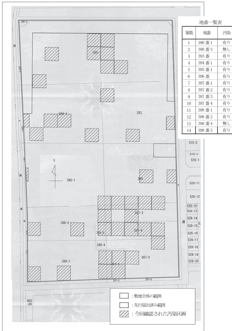
別図 指定する区域