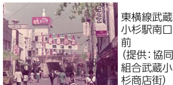
東横線武蔵小杉駅南口前

①「春が来た」/かわさき多摩川ふれあいロード ②「ニヶ領用水で夏の思い出、灯籠流し」/ニヶ領用水 ③「残葉」/全龍寺 ④「わくわく雪景色」/等々力緑地