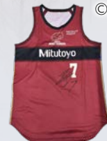
川崎ブレイブサンダース選手 サイン入りレプリカユニフォーム