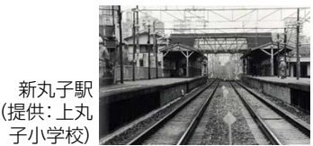
新丸子駅