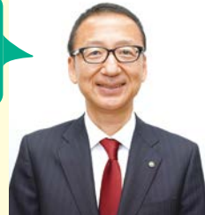
中原区長 板橋茂夫