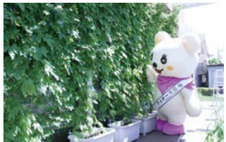
窓の近くで育てると直射日光を避けます