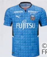
川崎フロンターレ選手 サイン入りユニフォーム