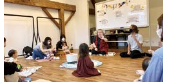
英語で楽しむ音楽クラス 活動の詳細はこちら

区制50周年おめでとうございます。常に変化し続けている町でありながら、人々とのつながりをとても大事にしている町です。そんな中原区で、今後も年齢関係なく音楽でつながる活動をしていけることをうれしく思います。