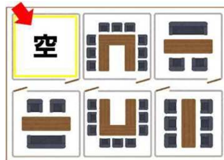
〔例2〕 ○○施設の第△会議室