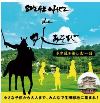
小さな子供から大人まで、みんなで生田緑地に集まれ!