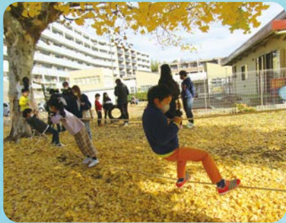
モンキーブリッジの様子