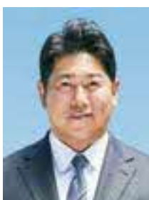
川崎市長 福田 紀彦

SDGs(持続可能な開発目標)は、2015年に国連で採択された全世界共通の目標です。誰一人取り残さず、全ての人にとってよりよい世界にするために、世界中の人がSDGsの達成に向けて動き出しています。日本においても、国や自治体、企業、市民などそれぞれが主体となり、2030年を年限とするSDGsに掲げられた17のゴールと169のターゲットの達成を目指して取り組むことが求められています。