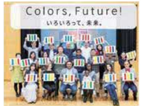
SDGsトレインに使用した写真

※「SDGsトレイン」は、実質的に100%再生可能エネルギーで走っている特別企画列車です。