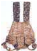
バンドリ (荷を担ぐ際の背中あて、山形県鶴岡市)

東北の気候風土が生んだ手仕事を2期に分けて紹介。第1期は寒冷地ならではの多彩なわら製品を展示します。◎1月4日～5月28日、9時半～16時半(3月からは17時まで) ¥入園料。