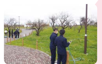
御幸公園の梅林の維持管理に協力する川崎総合科学高等学校ボランティア同好会