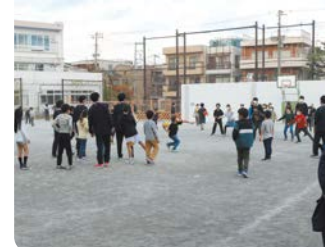
小学校の校庭開放で小学生と交流する幸高等学校のボランティア