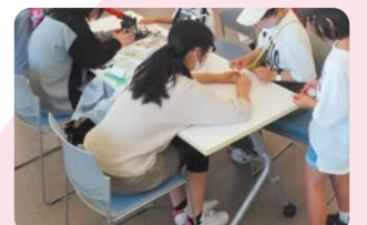
幸50祭で缶バッジコーナーの運営補助ボランティア