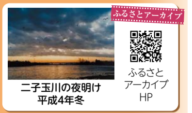
二子玉川の夜明け 平成4年冬