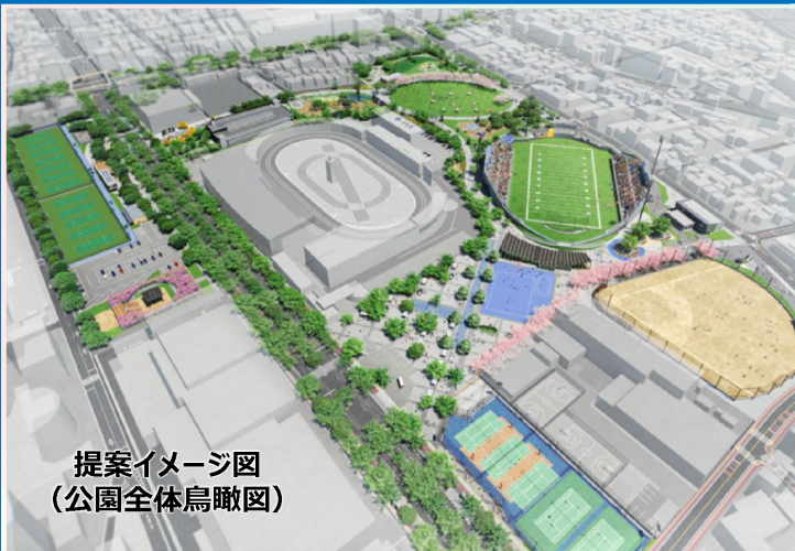
提案イメージ図 (公園全体鳥瞰図)

富士見公園再編整備事業は、「都心における総合公園としての機能回復」や「スポーツ・文化・レクリエーション活動の拠点機能の強化」を目的に策定した「富士見公園再編整備基本計画」に基づき実施する事業で、整備にあたっては、PFI制度とPark-PFI制度を併せて導入することとし、昨年12月に株式会社川崎フロンターレを代表企業とする富士見パークマネジメント株式会社と事業契約等を締結しました。