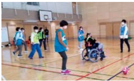
ウォーキングフットボールの様子

ウォーキングフットボールとは、歩いて行うサッカーのことです。年齢・性別・障害の有無に関係なく、多様な人たちが一緒になって、思いやりをモットーに、笑顔で楽しめるスポーツです。さまざまなバックグラウンドを持つ人たちが地域で自然につながり、「垣根のない社会」の実現に向けた取り組みの一助となるようウォーキングフットボールを中心としたイベントの実施などを行っています。