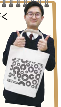
川崎市と平塚市の市章が入ったオリジナルトートバッグ