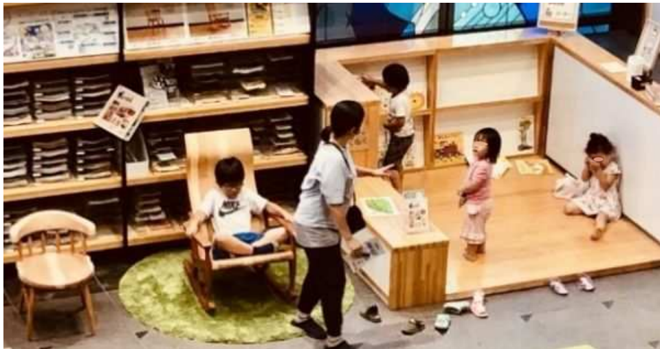
※参考：高津区役所1F市民ホールの天然木によるキッズスペース