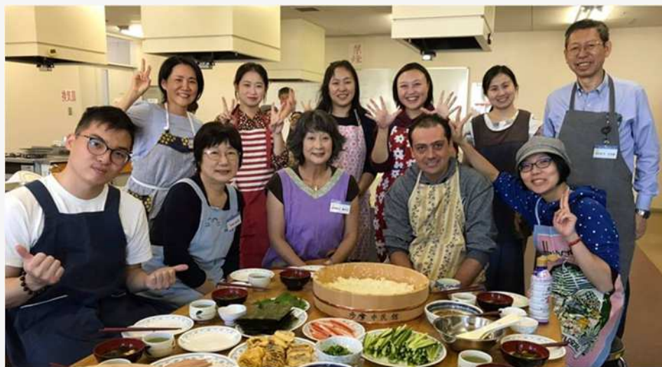
識字学級の学習者たちと手巻き寿司を作る