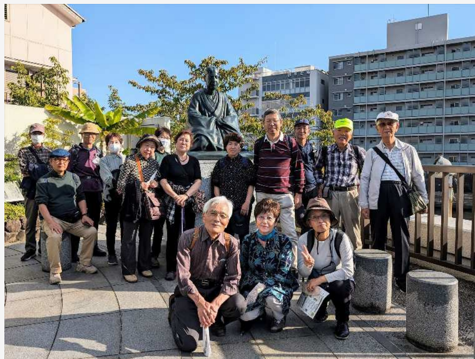
「歩く会」の仲間たち