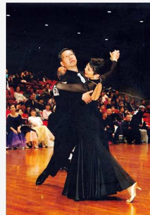
ダンスの競技会にて