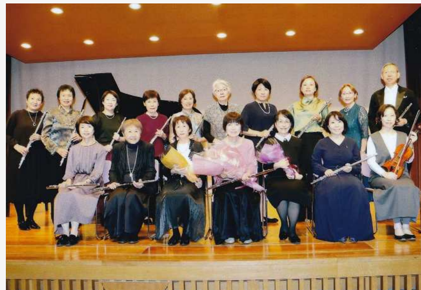
フルートアンサンブルの仲間