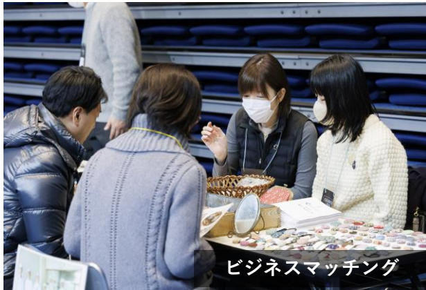
ビジネスマッチング