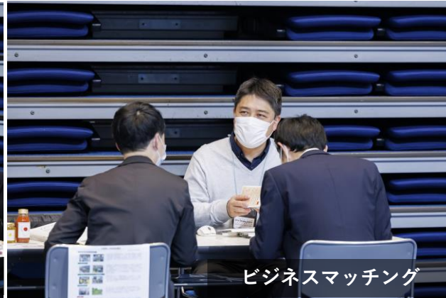
ビジネスマッチング