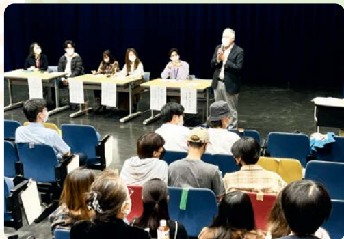
▲取り組みイメージ

義務教育を終えた外国にルーツを持つ高校生・若者を対象に、キャリア支援相談会や若者共生講座、アートによる自己表現のトレーニングなどを行い、外国にルーツを持つ高校生・若者が集い、共生を目指す場づくりに取り組めます。