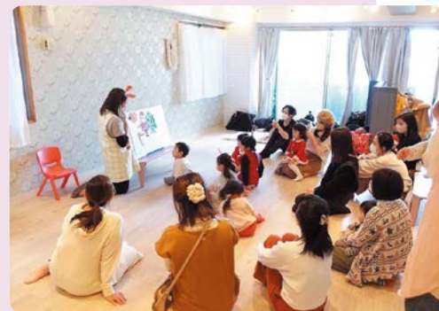
▲取り組みイメージ

子育てへの不安や保護者の孤独感を減らすため、子育てに役立つ親子イベントや保護者交流会を開催します。子育て支援者へのつながりの場の提供や教材の貸し出しなどにより、区内で子育てサポートをしている人、これから始めたい人たちのコミュニティ形成を目指します。