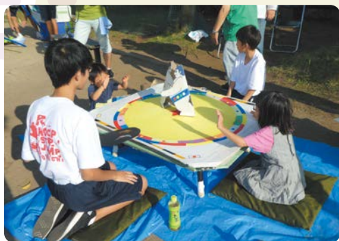
▲取り組みイメージ

市で2地域が指定されている「不燃化重点対策地区」の1つである小田周辺地区において、防災をテーマにしたスタンプラリーなどを開催します。防災空地の機能や役割などを知ってもらうことで、地域の防災意識の向上につなげます。