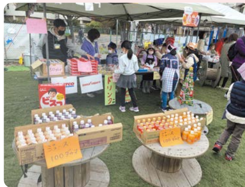
▲取り組みイメージ

子どもたちの「願い事」の実現を地域の力で支えるため、子どもたちが中心となり社会・経済の仕組みを学ぶイベントを4年度に引き続き開催し、その様子を映像コンテンツとして配信します。取り組みを通して、大師地区の魅力向上と活性化につなげていきます。