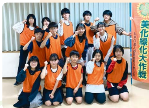
▲まちびらきに参加する子どもたち

区内の小学生～高校生を対象に「川崎区がもっと良くなるための」アイデアを募集し、それを高校生が中心となってイベントなどの形にしていきます。子どもが主体のまちづくりで、地域を活性化します。