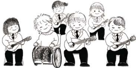
イラスト/金子真理

区内の福祉活動グループや福祉に関心のある人たちが「共に生きる地域づくり」を目指すイベントです。パラリンピック競技「ボッチャ」の体験やユニバーサルファッションショーなど、楽しみながら障害のある人や福祉への理解を深める企画が盛りだくさんです。明治大学マンドリン倶楽部による演奏会、「ともに生きる社会かながわ憲章」の広報も行います。