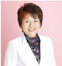
山口容子氏 (元テレビ朝日アナウンサー)