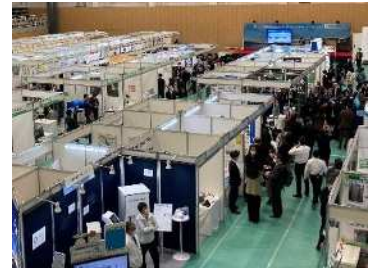
第15回川崎国際環境技術展の様子

SDGsや脱炭素等をテーマに、 新たなビジネスの展開へとつながる多種多様なプログラムを実施します。