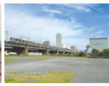
多摩川美化活動(左:年代不明、右:現在)