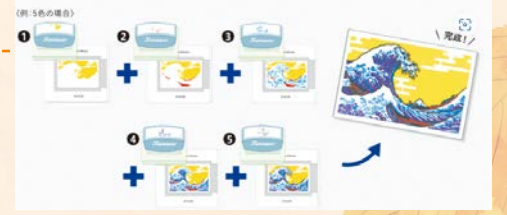
※実際の絵と異なります。

問区観光協会(事務局:区役所地域振興課)☎044-935-3132FAX044-935-3391