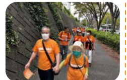
楽しくゴールを目指します