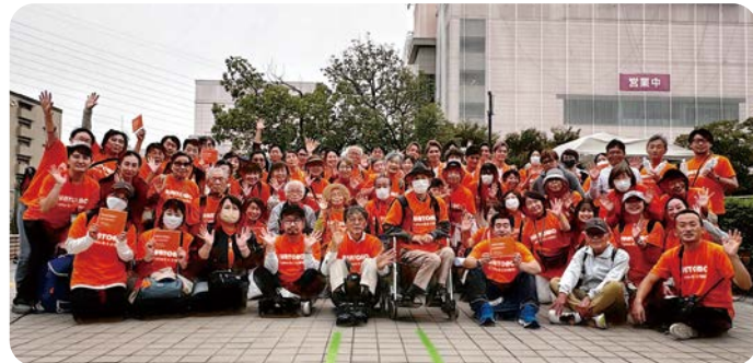
認知症にやさしいまちに向けて、最後に笑顔で集合写真

認知症の人や支援者、地域の人がりレーをしながら、たすきをつないで全国を横断する認知症啓発イベント。麻生区版が10月8日に新百合ヶ丘駅周辺で開催され、92人が集まりました。