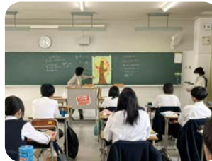
学校や職場、地域で養成講座が開かれています