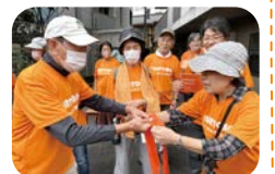
たすきに思いを託します