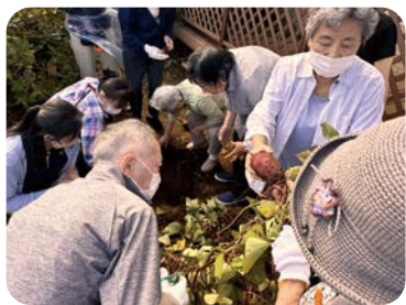
芋掘りなど、おしゃべり以外の活動も

認知症の人や地域の人が集まり、楽しいひとときを過ごしています。誰でも参加できるので、ぜひお越しください。