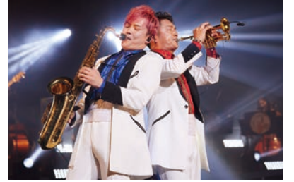
Passo a Passo/トランペット・サクソ