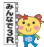
かわさき3R推進 キャラクター 「かわるん」