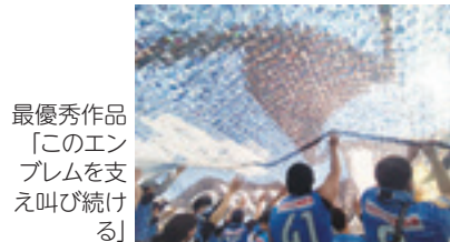
最優秀作品 「このエンブレムを支え続けよう」

入賞作品は12月26日から川崎ルフトン(川崎駅東口徒歩3分)の「2023川崎フロンターレ展」で展示します。