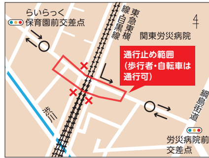
×:車両通行止め ○:車の転回場

下旬、24時間車両通行止め🔗建設緑政局南部都市基盤整備事務所 ☎044-755-2277 FAX 044-755-1444。※詳細は市HPで。